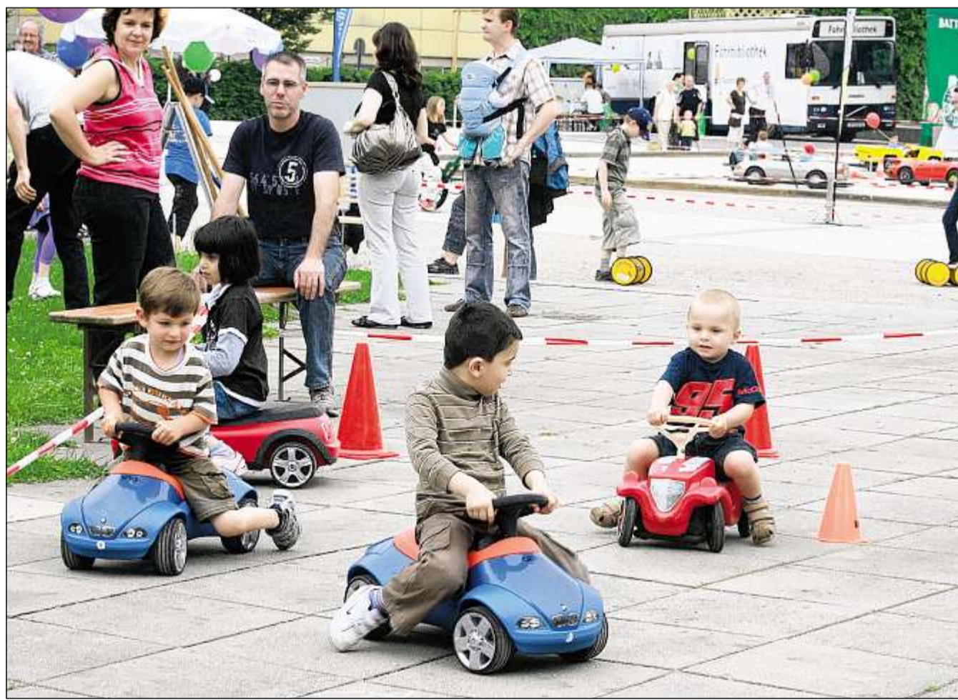
WO BITTE GEHT'S ZUM NÜRBURGRING? Gestern konnten die kleinen Flitzer schon mal für die Zukunft üben. Im Enzaupark herrschte Jahrmarktstimmung mit verschiedenen Spiel- und Sportaktionen für Kinder und Jugendliche.

Sportlich ging es außerdem an verschiedenen Ständen zu. Der Hockeyclub Pforzheim lud zu Probeschüssen auf ein Tor ein. Kanufahren auf der Enz bot die DRLG-Jugend an. Die Judofreunde Pforzheim und der Judo-Club führten Interessierten ihren beeindruckenden Sport vor. All das betrachtete die kleine Lea mit großen Au-