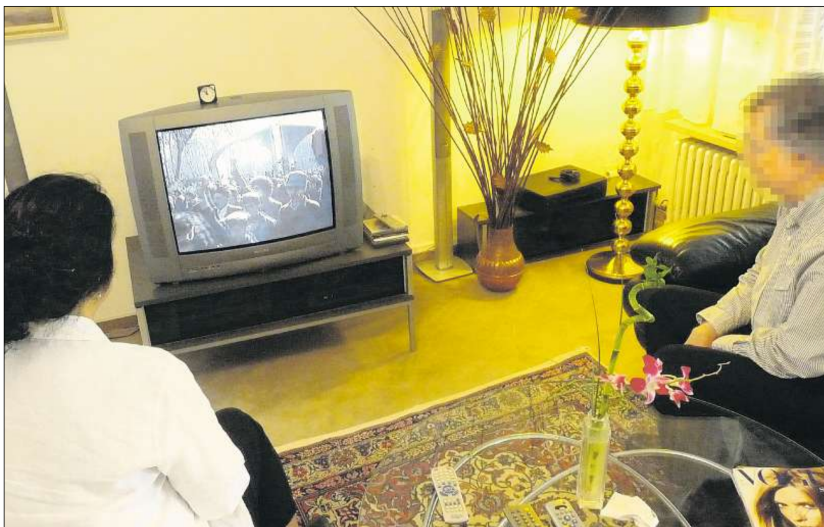
DAS IRANISCHE STAATSFERNSEHEN gehört zum Pflichtprogramm, ist für diese beiden in Pforzheim lebenden Iraner aber nur eine höchst unzuverlässige Informationsquelle. Mehr von der Situation in ihrem Heimatland erfahren sie durch gelegentliche Telefonate nach Teheran.

Ispringen. Die Stadtbahnhaltestelle Ispringen-West wird in diesem Jahr noch nicht gebaut. Durch den schwierigen Untergrund verzögert sich die Baumaßnahme. Weitere Ergebnisse sollen in den nächsten Wochen vorliegen. (Seite 29)